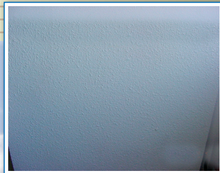
後残り及び表面の変色等無く完全除去