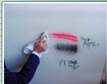
ラッカーシンナーも可