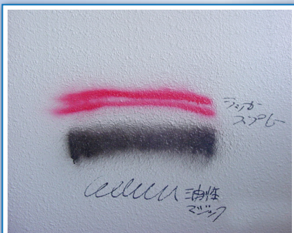
一般のビル外装壁に対するFX処理面を想定