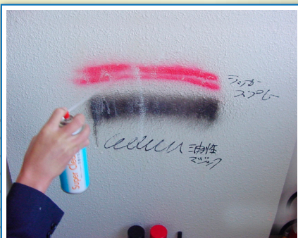
消せる君(オレンジオイル系)洗浄剤使用