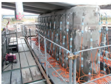
リハビリカプセル工法施工状況