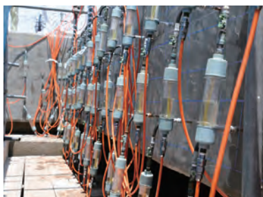
リハビリカプセル設置状況