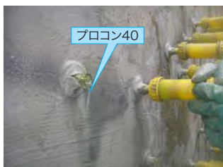
プロコン40先行注入の状況