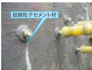
超微粒子セメント系注入材本注入の状況