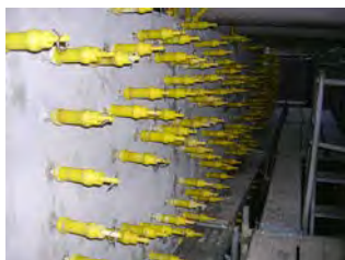
リハビリシリンダー設置状況