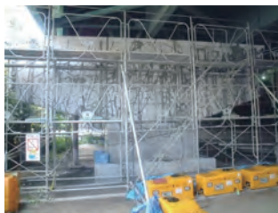
橋脚(はり部)のASR補修事例