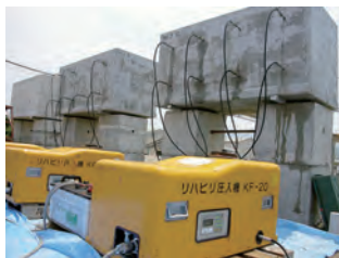
大型供試体によるASR抑制効果検証実験